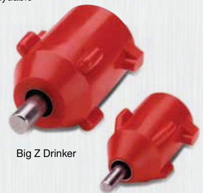
Big Z Drinker