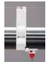
Big Ace Clip-On