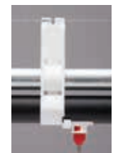
Big Ace Clip-On