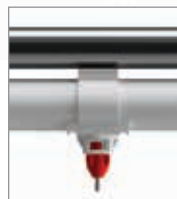
Sela de fixação

Feito de material plástico resistente, este tubo é eficiente em custo e com alto grau de UV (Ultra Violeta) e resistente a produtos químicos. O interior do tubo não tem praticamente nenhuma obstrução afim de tornar o flushing eficaz.