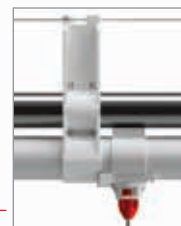
Suporte de Fixação

O tubo redondo de suporte do perfil Ziggity fornece resistência máxima e estabilidade para reduzir o balanço da linha de bebedouros.