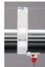
Big Ace Clip-On